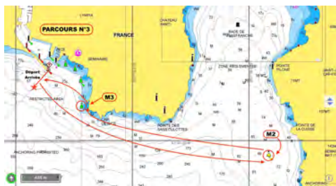
Le parcours 3 pour les Optimist et les Open Bic

Le 13 janvier 2018 le Club Nautique de Nice crée un record perpétuel, « l'Adonnante Cup ». Il s'agit de battre le record de vitesse à la voile sur un parcours qui va de Nice à Villefranche ou Beaulieu suivant les classes de bateaux.