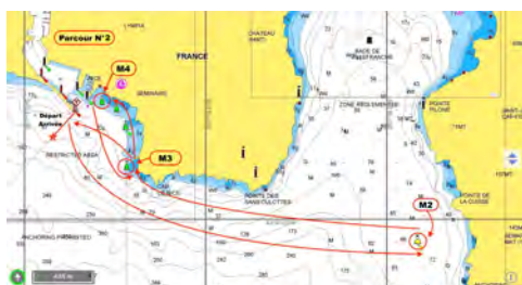
Le parcours 2, pour les Laser et les catamarans